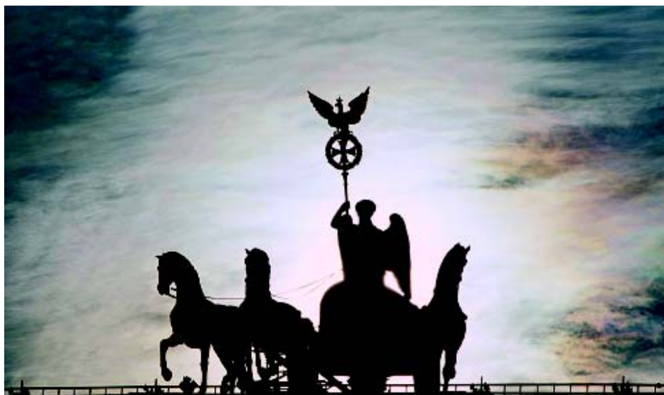
Puerta de Brandemburgo