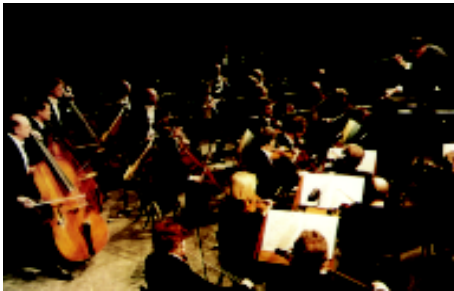
Filarmónica de Berlín

Lo extraordinario de este comentario es que conserva hoy, un siglo más tarde, toda su vigencia.