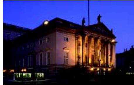
Opera del Estado «Unter den Linden»