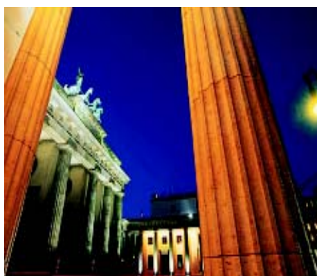
Puerta de Brandemburgo

Turismúsica ha preparado un viaje excepcional para melómanos incurables. La capital alemana se supera a sí misma para despedir el año y se convierte en incomparable Meca musical. ¿Qué otra ciudad en el mundo puede vanagloriarse de tres teatros líricos de la máxima categoría, o ufanarse de tener a la Orquesta Filarmónica con Simon Rattle, a la Staatskapelle con Daniel Barenboim y a la Orquesta Sinfónica Alemana con Kent Nagano?