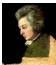
W. A. Mozart